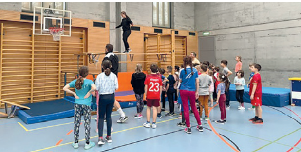
Impressionen aus der Turnhalle.

Der nächste Sunday4Kids findet am Sonntag 26. März statt. Wir bitten Sie, Ihre Kinder bis spätestens 23. März anzumelden. Dies zur Sicherheit Ihrer Kinder und zur Planung der Helferinnen und Helfer.